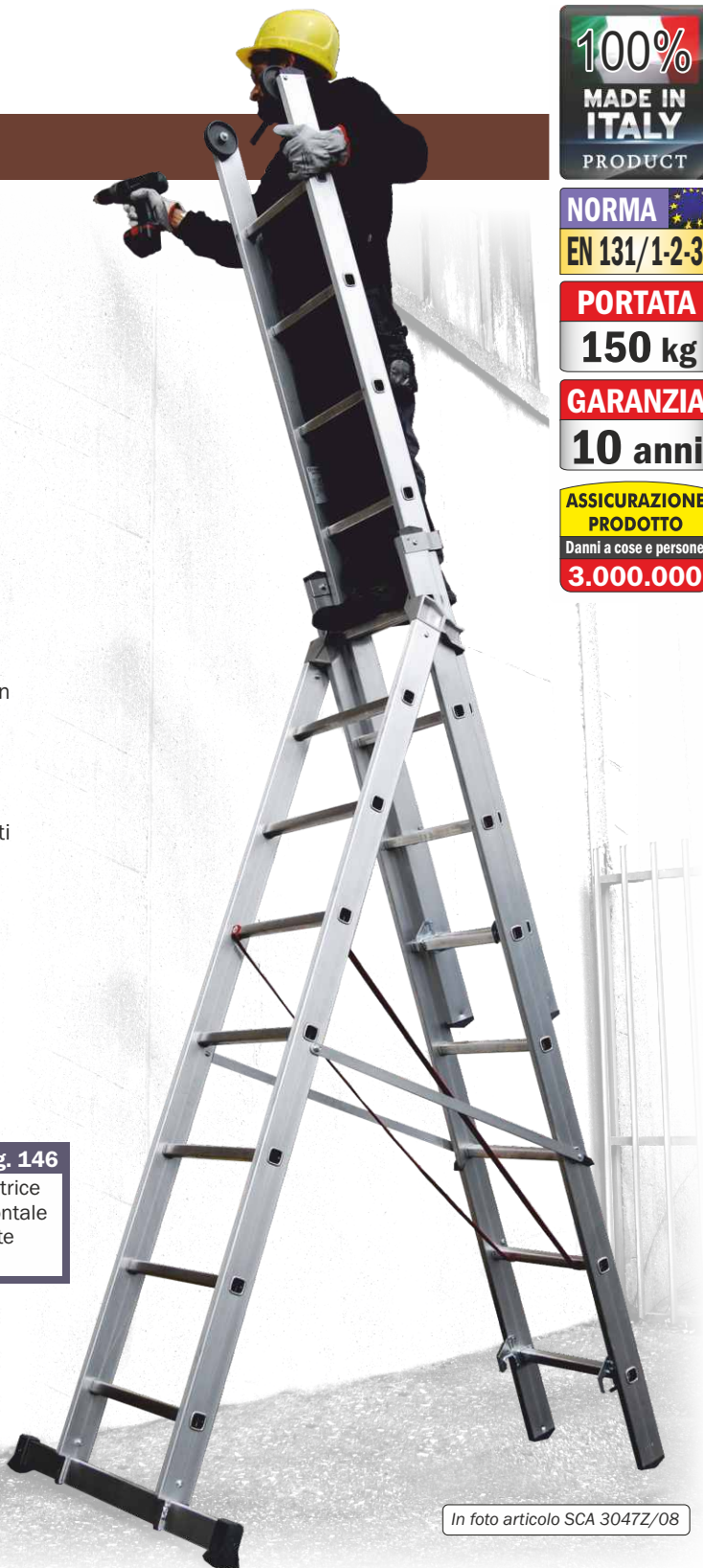
In foto articolo SCA 3047Z/08

sono dotati di dispositivo ad uso «ZOPPO» che consente di compensare pendenze, scalinate o forti dislivelli per poter adattare la scala anche alle condizioni più difficili