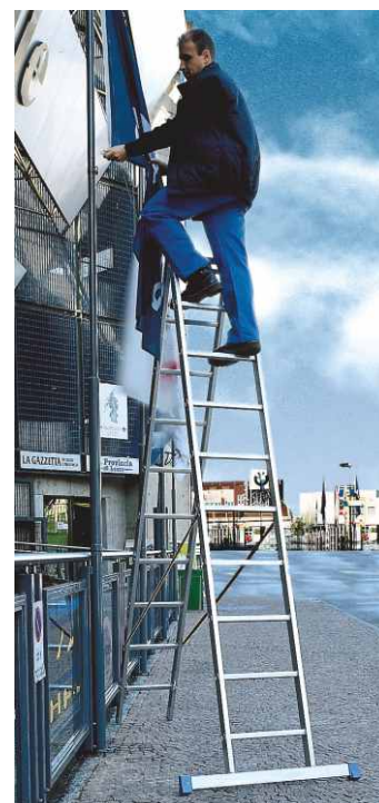
In foto articolo SCA 3045Z/09