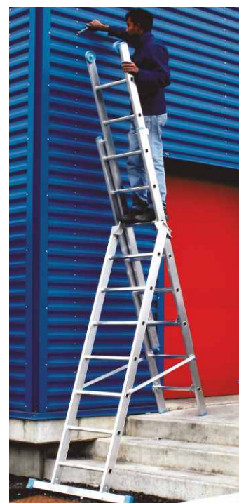
In foto articolo SCA 3047Z/08