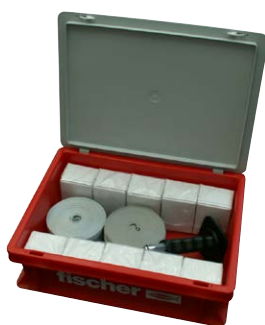
Box bandella in tessuto GWB