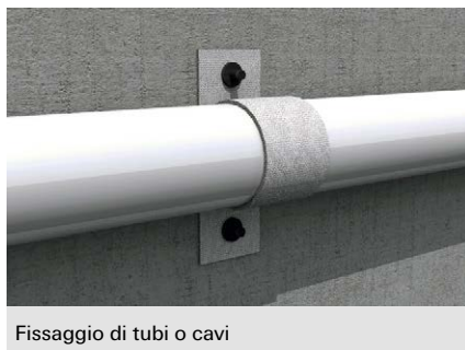
Fissaggio di tubi o cavi