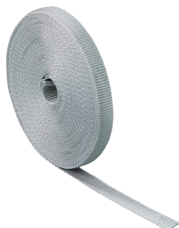
Bandella in tessuto GWB