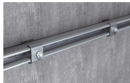
Installazione binario di montaggio a muro