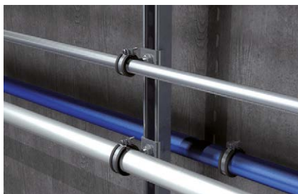
Installazione laterale tubazioni su binario di montaggio