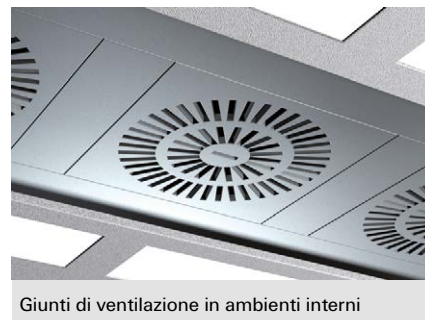
Giunti di ventilazione in ambienti interni