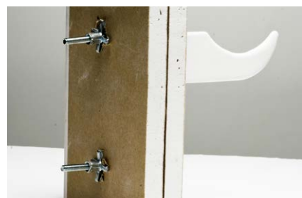
Espansione del tassello HM