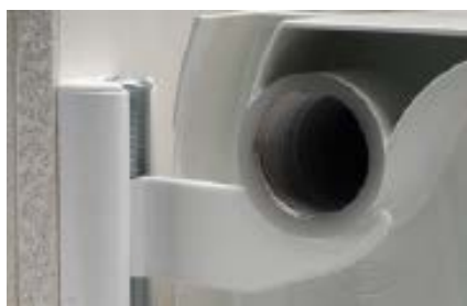
Fissaggio su lastra montata