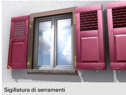
Sigillatura di serramenti