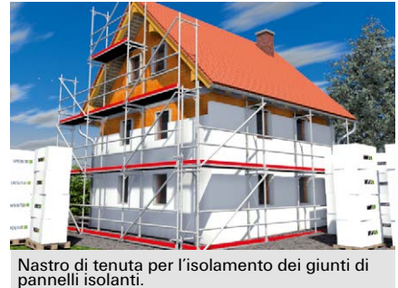
Nastro di tenuta per l'isolamento dei giunti di pannelli isolanti.