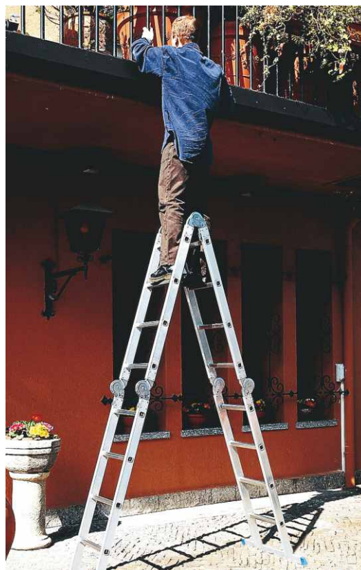
In foto articolo SCA 3043/4