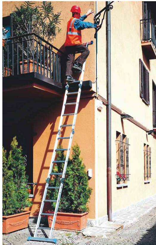
In foto articolo SCA 3043/4